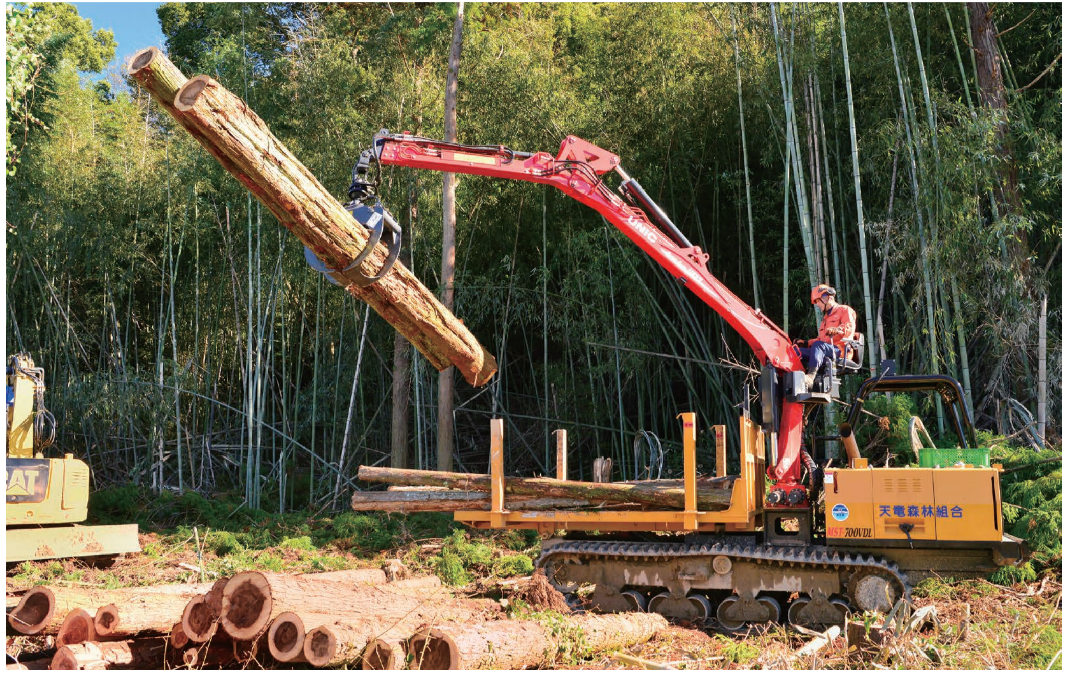
題名: 積み込み作業 令和3年度しずおか森林写真コンクール入選 撮影地: 磐田市神増